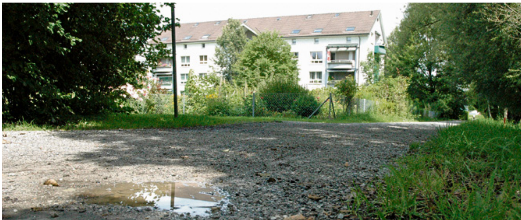
Pfützen ade: Die Eichstrasse soll demnächst auf der gesamten Länge asphaltiert werden.